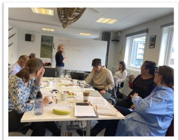
5 Tematisk møde om retten til sundhed, afholdt 3. september 2021

Derudover afholder Rådet to tematiske møder om året, hvor der gives input til udarbejdelse af statusrapporter eller drøftes FN eksaminationer. I 2021 afholdt Rådet tematiske møder den 5. februar og den 3. september.