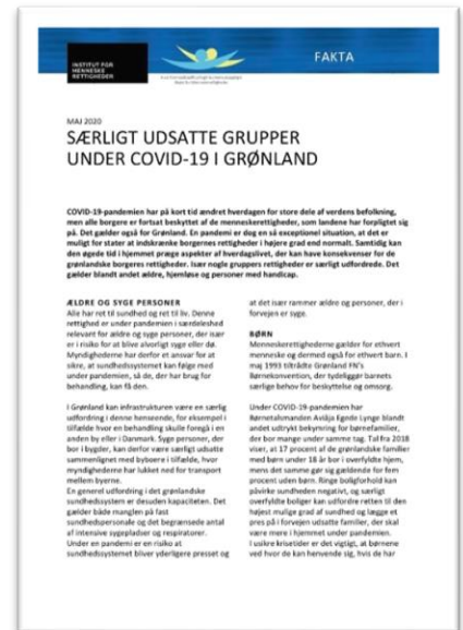
Faktaark om Covid-19

Året har som de foregående år været præget af manglende rådssekretariat. Det lykkedes desværre ikke at fastholde en fastansat sekretariatsleder trods flere forsøg, bl.a. grundet